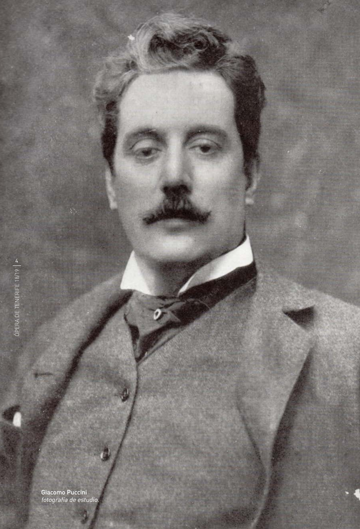
Giacomo Puccini fotografía de estudio.